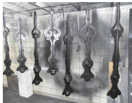
De wereldbol, cijfers en klepels in restauratie