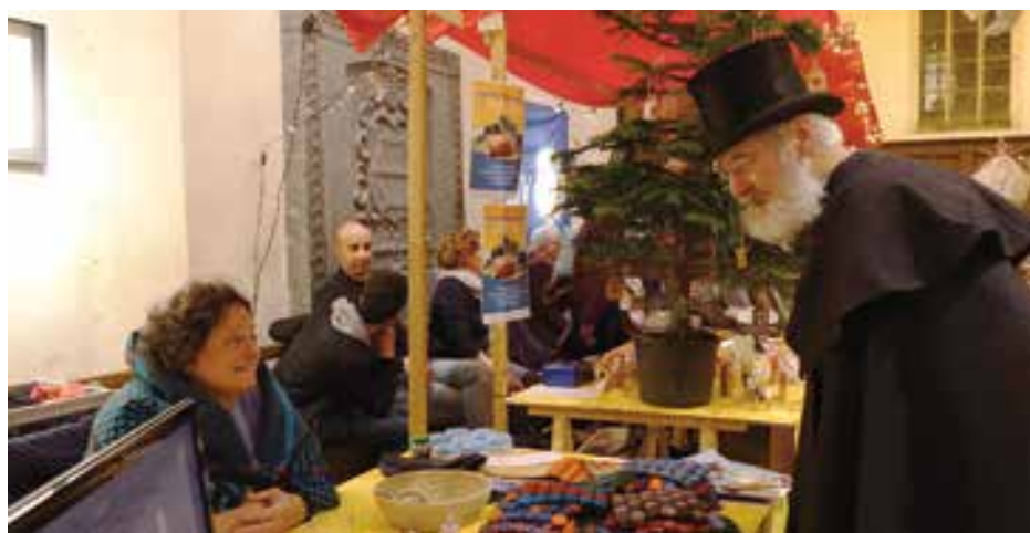
Goede Doelenmarkt Lochem

Begin december is op de website www.goededoelenmarkt-lochem.nl het complete aanbod en programmaoverzicht te vinden.